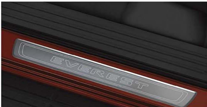
Ốp bạc cửa