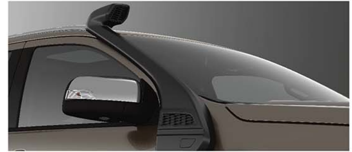
Ống lấy gió trên cao