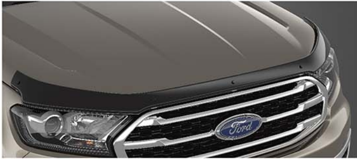
Ốp trang trí nắp Capo