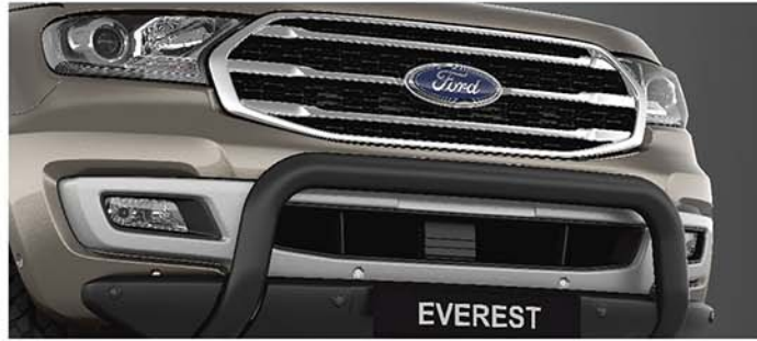
Thanh cản trước