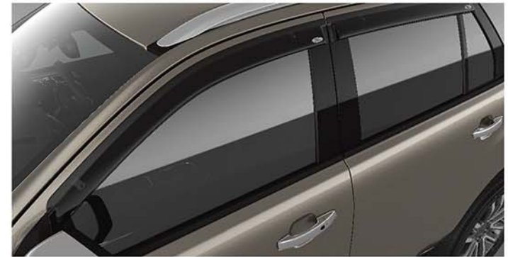
Vè che mưa