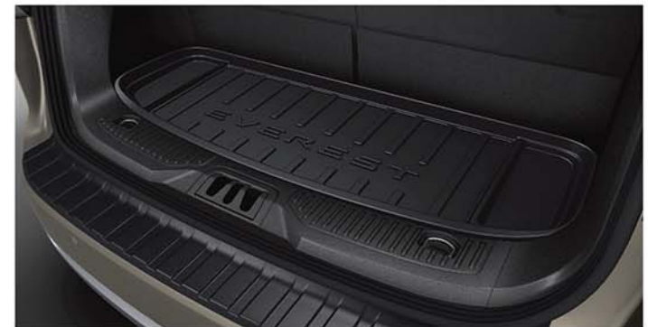
Tấm lót cao su cho khoang hành lý