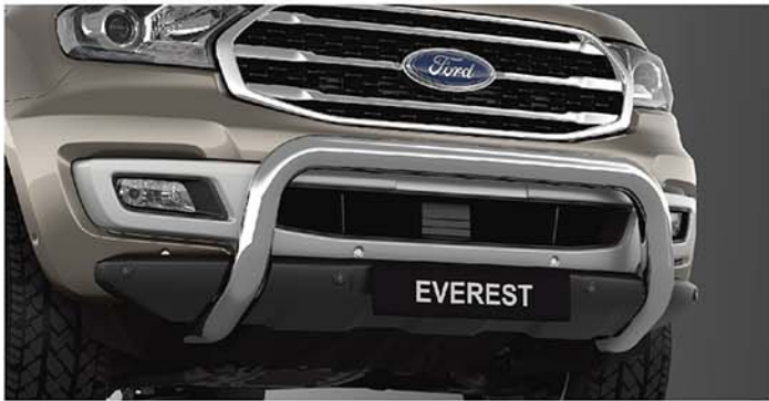
Thanh cản trước mạ Chrome