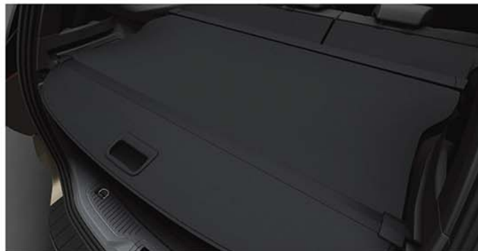
Tấm phủ cho khoang hành lý