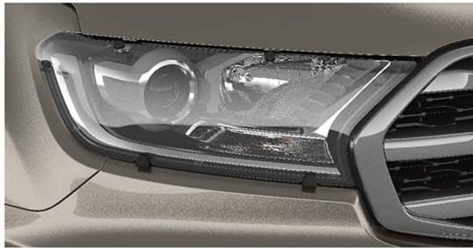
Ốp bảo vệ đèn